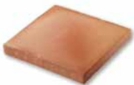
cm 20x20x2.5 Cod. 01ABAAR