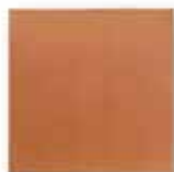
cm 20x20x1.3 Cod. 01ABA