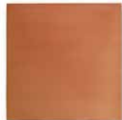
cm 30x30x1.3 Cod. 03ABA