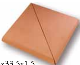
cm 33,5x33,5x1.5 Cod. 04SBA