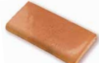
cm 15x30x2.5 Cod. 10SBA