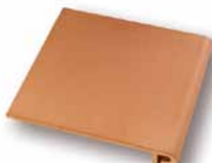
cm 30x33,5x1.3 Cod. 02SAA