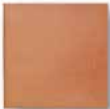
cm 20x20x1.3 Cod. 01ABAA