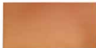
cm 40x20x1.3 Cod. 06ABA