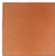
cm 25x25x1.3 Cod. 02ABA