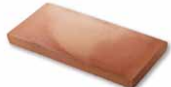
cm 15x30x2.5 Cod. 05ABAAR