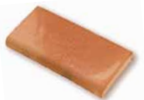
cm 13x26x2.5 Cod. 03SBA