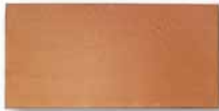
cm 40x20x1.3 Cod. 06ABAA