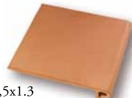
cm 25x33,5x1.3 Cod. 01SBA