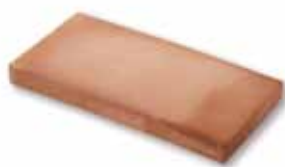
cm 13x26x2.5 Cod. 04ABAAR