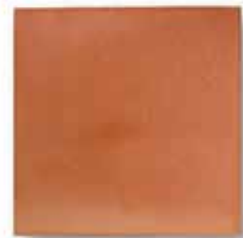
cm 30x30x1.3 Cod. 03ABAA