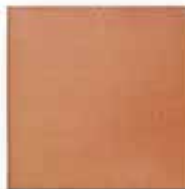
cm 25x25x1.3 Cod. 02ABAA