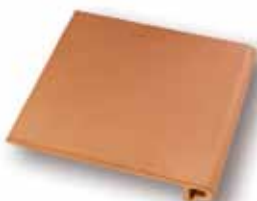
cm 25x33,5x1.3 Cod. 01SAA