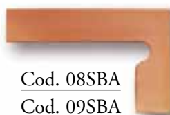
Cod. 08SBA Cod. 09SBA