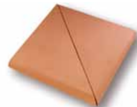
cm 33,5x33,5x1.3 Cod. 04SAA