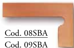
Cod. 08SBA Cod. 09SBA