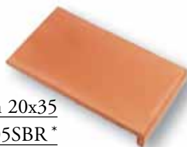
cm 20x35 Cod. 05SBR* Cod. 05SBA*