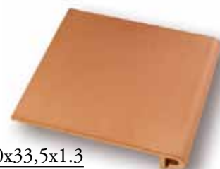
cm 30x33,5x1.3 Cod. 02SBA